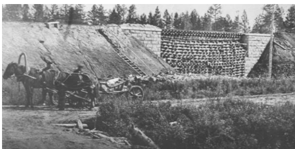
Строительство железной дороги

был принят законопроект государственной думы о строительстве Амурской железной дороги и утвержден императором.