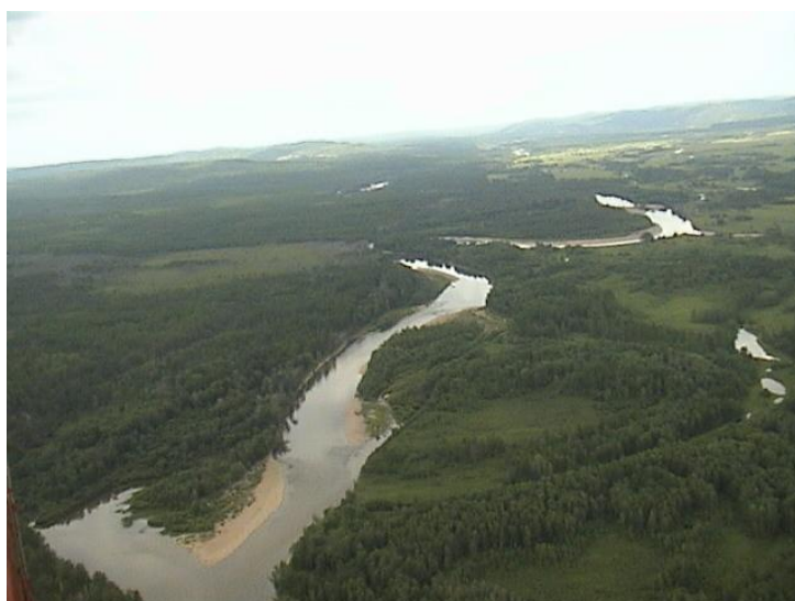
Река Большой Невер.