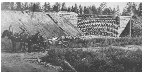
Строительство железной дороги

В 1908 году в (63 верстах) от Амура по р. Большой Невер, в месте, где железная дорога (по проекту) должна входить в долину этой реки образовывается поселение п. «Змеинный».